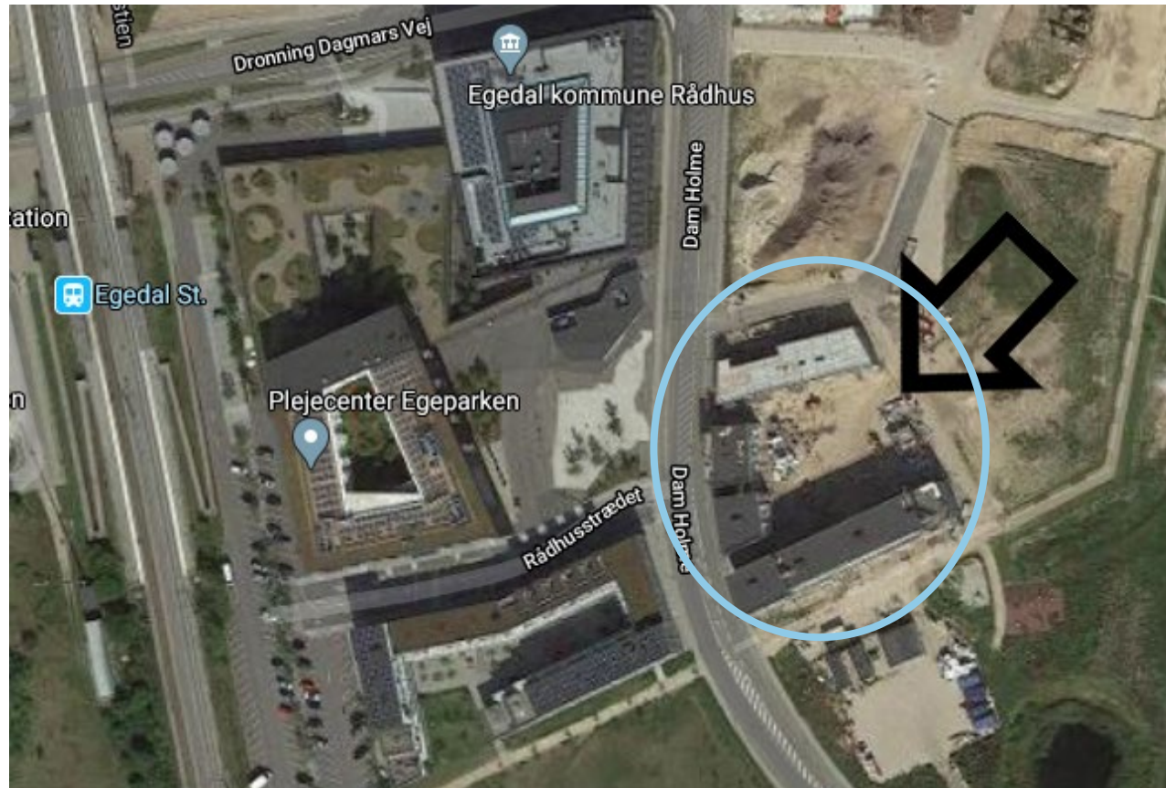
Luftfoto – google maps