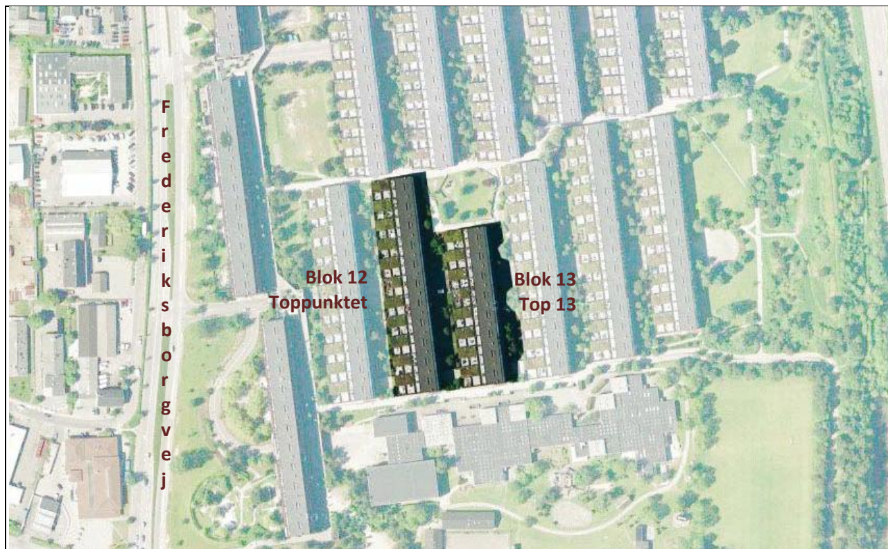
Blok 12 og 13 i Farum Midtpunkt – Svanepunktet – med seniorbofællesskaber i tagetagen