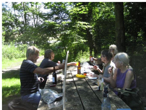
Tur til Roskilde Fjord 19.07.2016

Hen over året kan der være flere andre arrangementer – traveture , museumsbesøg , mindre udflugter . Ofte sker det spontant ved at én eller flere får en god idé og mailer ud til alle. Så kan de som har lyst og mulighed, mødes ved den angivne elevator på det angivne tidspunkt og tage med. Andre gange skal der mere organisering til – f.eks. kræver det noget mere at rejse til Spanien for at gå Caminoen. Der kan også spontant opstå en fest, som så stables på benene i løbet af en dags tid eller to. Eller bofæller med fælles interesse aftaler et privat arrangement.