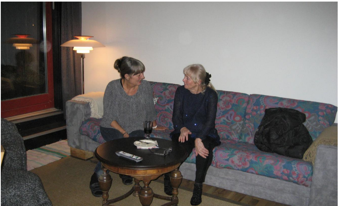
Fest i Fællesstuen 13.11.2015