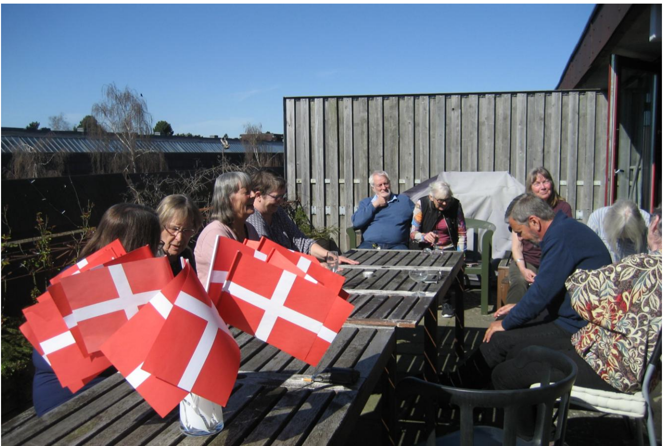
Toppunktets 4 års fødselsdag 01.04.2019